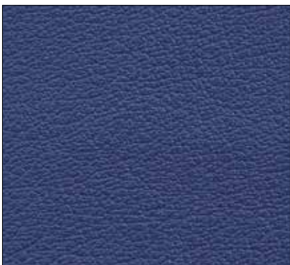
WL - BLU SCURO DARK BLUE