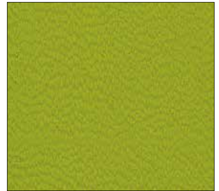
WT - VERDE LIMONE GREEN LEMON