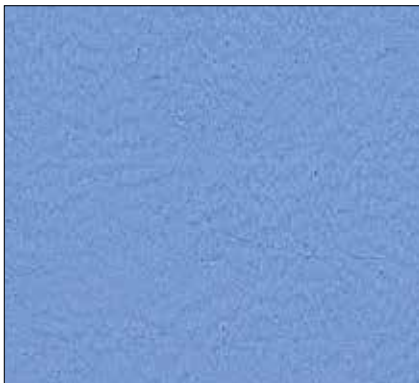
WR - AZZURRO FIORDALISO LIGHT CORNFLOWER BLUE