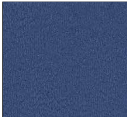
W2 - BLU CHIARO LIGHT BLUE