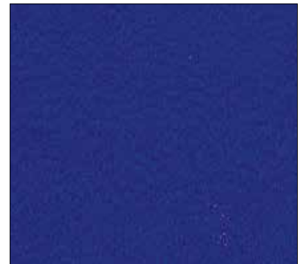
W3 - BLU MARINO MARINE BLUE

IMPORTANT: Upon placing the order, please remember to specify the code for the chosen upholstery along with the main item code.