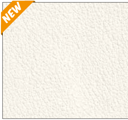
WN - AVORIO IVORY