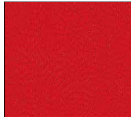
WF - ROSSO RED