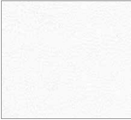
WA - BIANCO WHITE