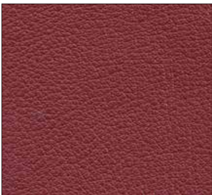
WH - BORDEAUX BURGUNDY