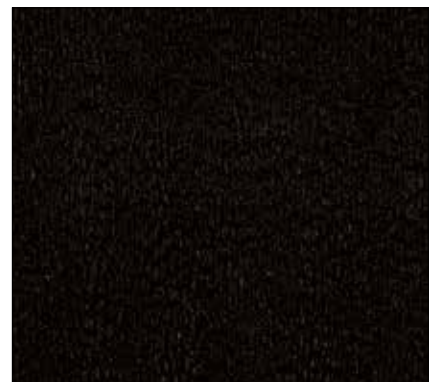
WP - NERO BLACK

IMPORTANTE: In caso di ordine per cortesia ricordarsi di specificare il codice del colore di tappezzeria insieme al codice del prodotto