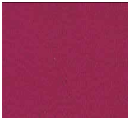
W9 - FUCSIA FUCHSIA