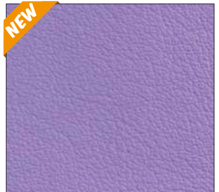
WQ - LILLA' LILAC