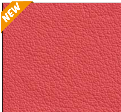
WG - CORALLO CORAL