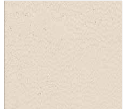
W8 - BEIGE BEIGE